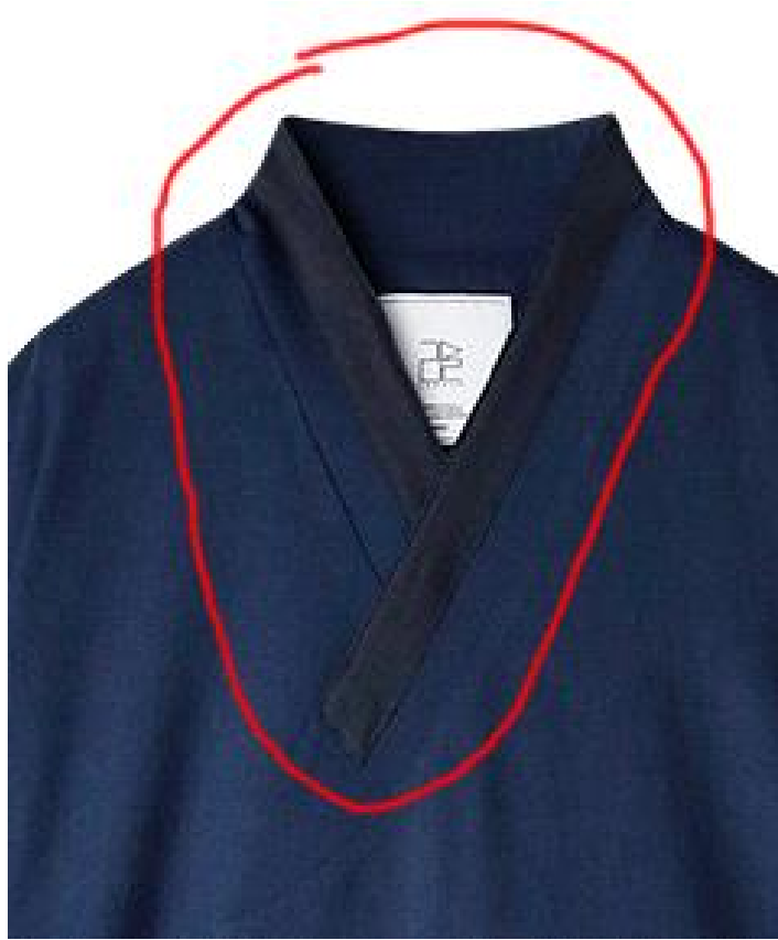
바른 모양 - 동정을 겹으로 눌러박은 것 (떨수 있음)