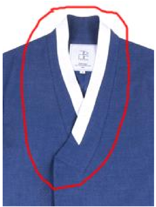
틀린 모양 - 동정을 콤비네이션. 떨수 없음